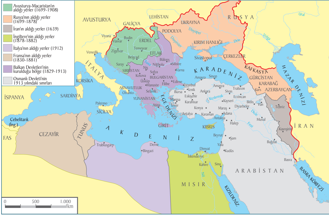
20. Yüzyıl Başlarında Avrupa ve Osmanlı Devleti'nin Durumunu Gösteren Harita